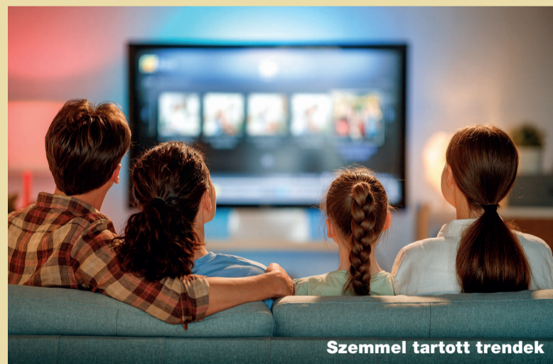
Szemmel tartott trendek

Az instabil gazdasági világ-helyzet szintén a streaming malmára hajtja a vizet, mivel az infláció megugrásával egyszerűen kevesebb az otthonon kívüli szórakozásra elkölthető pénz.